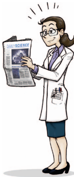
Ilustración por gentileza de Alberto García Gómez (albertogg.com).

La característica observada, tomada con el potente instrumento SPHERE (Spectro-Polarimetric High-contrast Exoplanet REsearch instrument), podría ser la primera evidencia directa de la existencia del nacimiento de un nuevo planeta . Observad que la imagen es fruto de observaciones reales, ¡no es una figura artística! https://www.eso.org/public/news/eso2008/